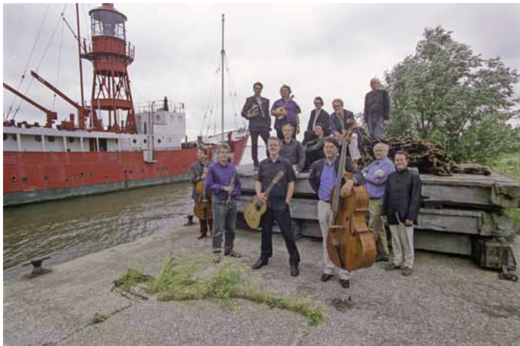
NIEUW ENSEMBLE