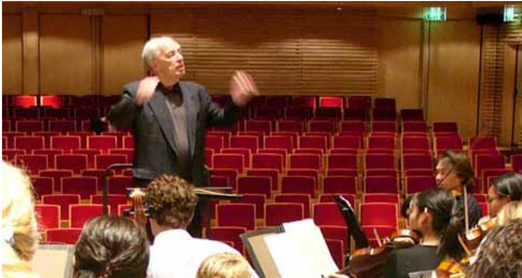
PIERRE BOULEZ IN MUZIEKGEBOUW AAN 'T IJ - JUNI 2007